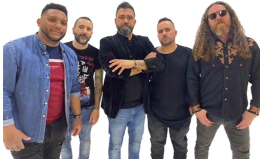
Sin Enchufe. Tributo a M-Clan